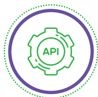
API Management Platform (Telco/Banking)

複数年にもわたってhSenid Mobileはコアシステムの統合により、18ヶ国以上の通信会社、企業、および銀行を支援してきました。イノベーションは組織の特徴で相互に有益なビジネス関係を生み出しながら豊富な実績と取り扱いサービスから最適なソリューションをご提案します。