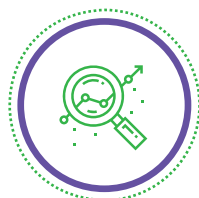
Big Data & Analytics