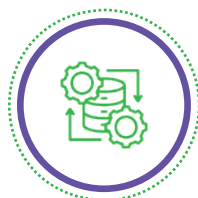
System Integrators (SIs)