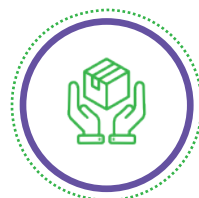
VAS Aggregators & Resellers